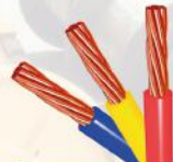
انواع سیم خودروبی