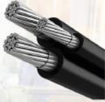
انواع کابل خود نگهدار