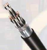
انواع کابل ابزار دقیق