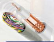
انواع کابل مخابراتی و گواکسیال